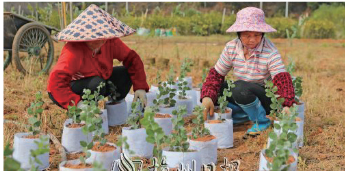
我市各大苗圃基地開啓“忙碌模式”,工人正忙着育苗。

記者從市林業局了解到,今年,我市將圍繞實體經濟發展、鄉村振興兩大重點,因地制宜推進造林綠化、撫育提升等工程,認真實施山水林田湖草沙一體化保護和修復項目,持續推進高質量水源林建設、大徑材培育基地建設、中幼林撫育等工作,高標準打造縣城森林城市,高質量實施國儲林工程,積極探索碳普惠項目。在新建5.7萬畝高質量水源林的同時,加快國儲林項目集體林地收儲進度,積極探索國儲林建設與森林康養、竹木加工等產業融合發展路徑。