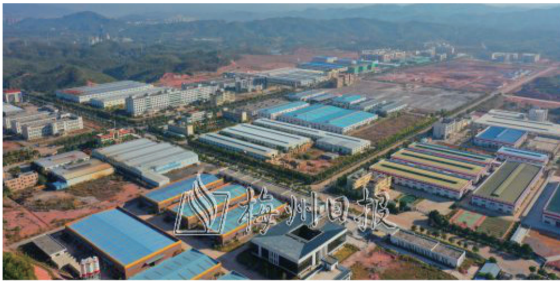
平遠高新區工業園標準廠房林立。

“舉全縣之力實施工業興縣!”十四五時期,平遠縣以更大魄力、在更高起點上提出新目標,緊抓主導產業培育提升,切實壯大實體經濟。今年來,廣東燦陽年產1.5萬臺高中低壓成套設備項目投產,富遠稀土年處理5000噸中鈿富鎔稀土分離生產線產能置換項目開工,廣東盈華年產1000萬張覆銅板生產線亮牌投產倒計時……平遠縣狠抓發展第一要務,全面激發內生動力,依托省級高新技術產業開發區平臺,全方位築巢引鳳,興產業加快集聚發展。